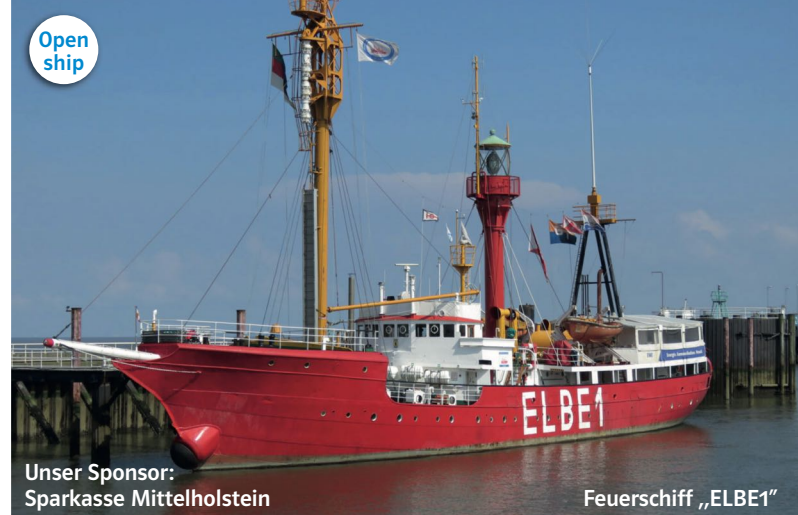
Unser Sponsor: Sparkasse Mittelholstein